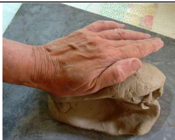
Façonner (modeler) une pâte molle (céramique par exp)