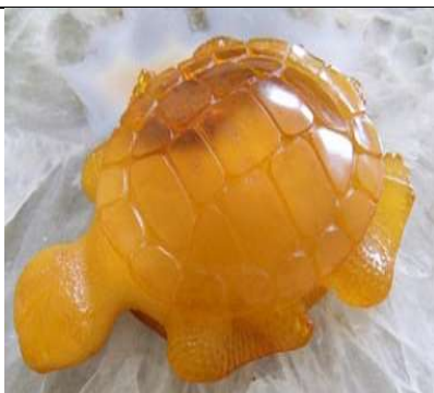
Sculpture en ambre