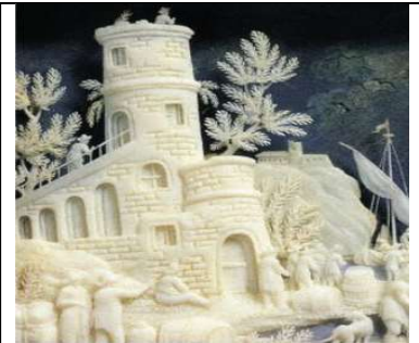
Sculpture en ivoire