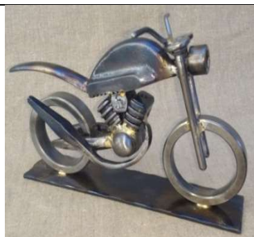
Sculpture en fer