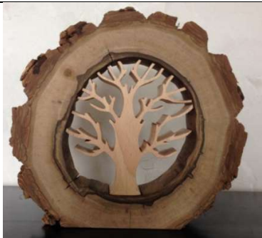
Sculpture en bois.

Matières utilisées : les matières dures, telle que: