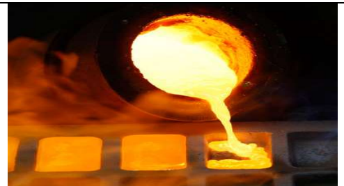
Couler des métaux (fondre) dans des moules ciselés

Matières utilisées : les matières dures, telle que: