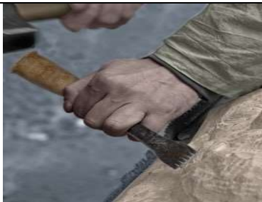
Tailler au moyen du ciseau