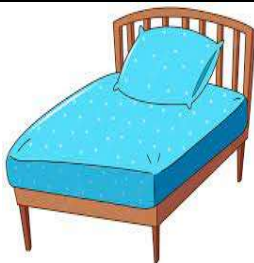
un lit - un lit