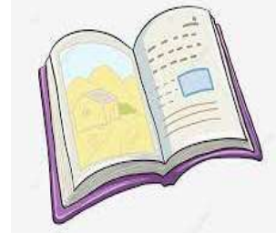
un livre - un livre