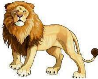
un lion - un lion