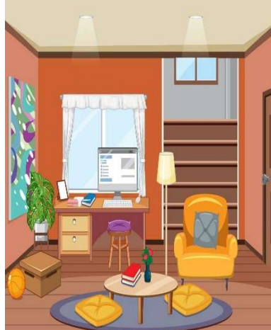
le salon le salon