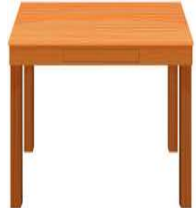
une table une table