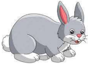
un lapin - un lapin