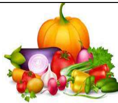
des légumes - des légumes