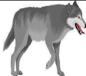
un loup - un loup