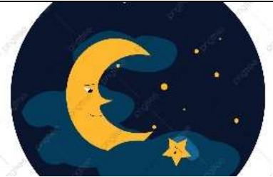
la lune - la lune