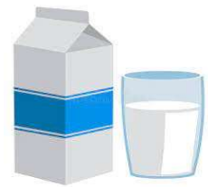
du lait - du lait