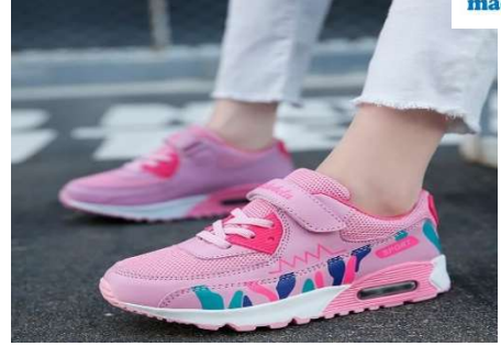
des baskets - des baskets