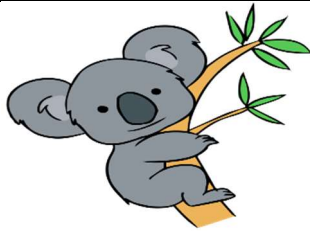
le koala - le koala