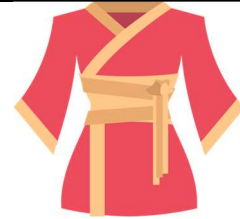
un kimono - un kimono