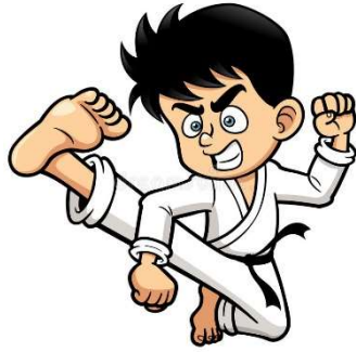
le karaté - le karaté