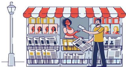
un kiosque - un kiosque