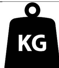
un kilo - un kilo