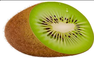
un kiwi - un kiwi