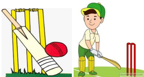
le cricket - le cricket