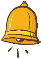
La c loche