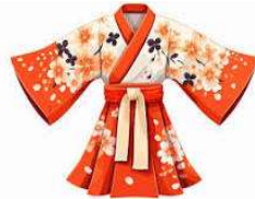
Le k imono