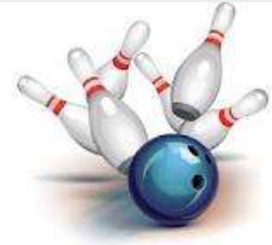
Des q uilles