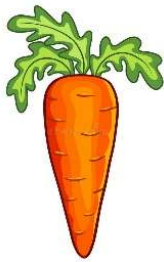
Une c arotte