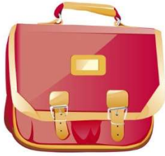
Un C artable