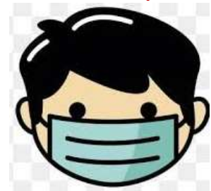
Un q masque