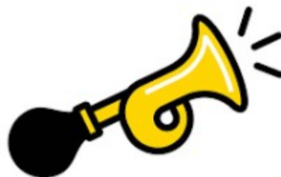
Un k laxon