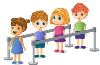
Une q ueue