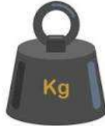
Un k ilo