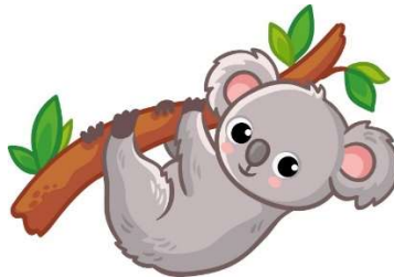
Un k oala