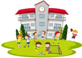
Une c ole