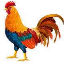
Un q oq