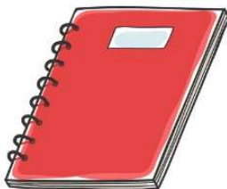
Un c ahier