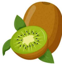
Un k ivi