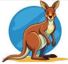
Un k angourou