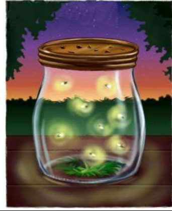
مصدر طبيعي للضوء: الحشرات المضيئة