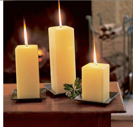
مصدر اصطناعي للضوء : الشموع