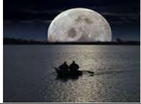
مصدر طبيعي للضوء: القمر