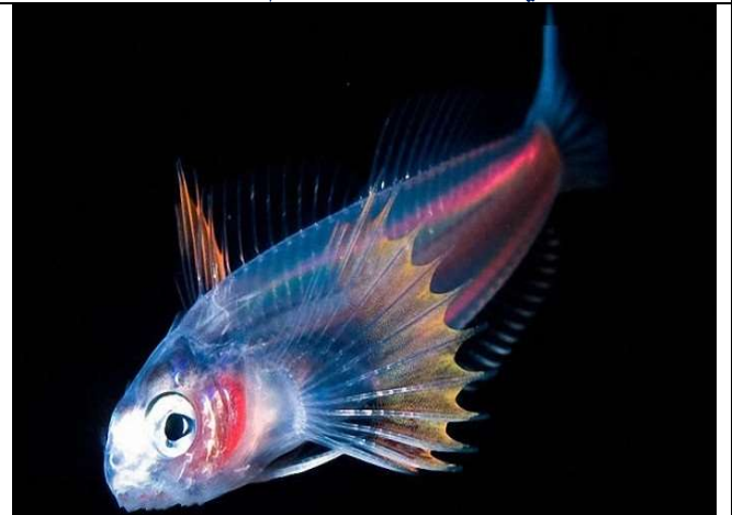
مصدر طبيعي للضوء : الأسماك المضيئة