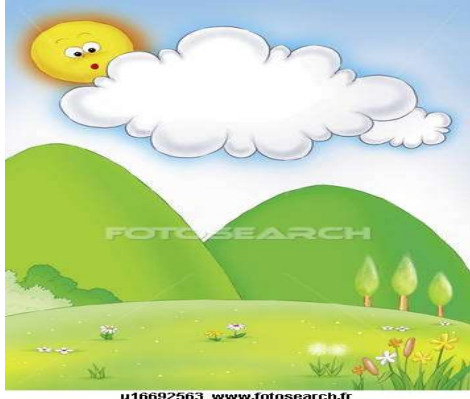
مصدر طبيعي للضوء : الشمس