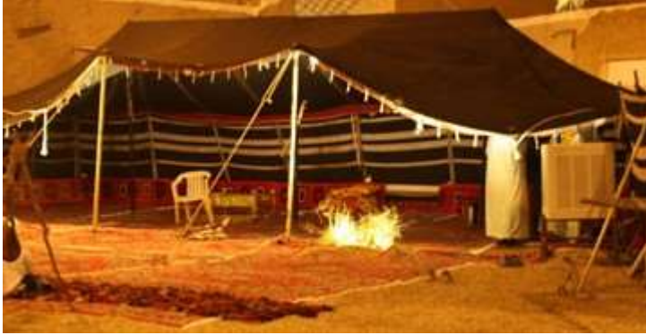
مصدر طبيعي للضوء : النار