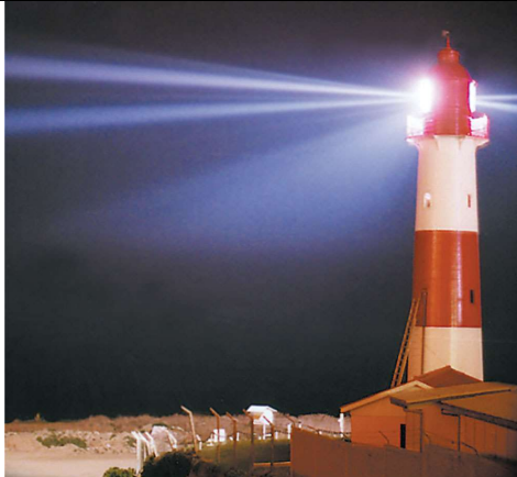
مصدر اصطناعي للضوء : المنارة