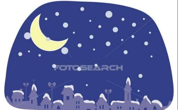
مصدر طبيعي للضوء : النجوم