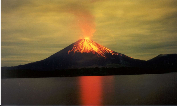
مصدر طبيعي للضوء : البركان