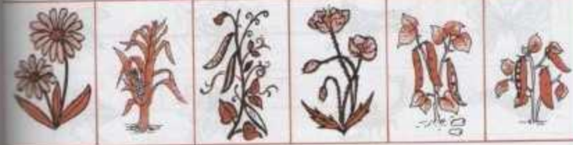
اشطب على الصورة التي لا تعفيل بعلة