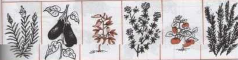
يؤذي النباتات التي يتناول سمومها الإنسان