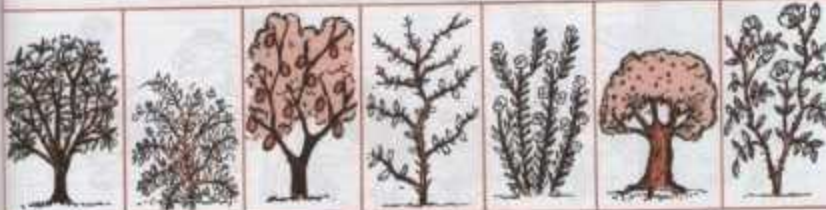
ضع علامة x تحت صورة كل شجيرة