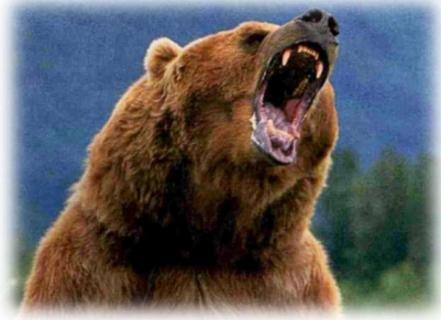
L'ours gronde ou hurle