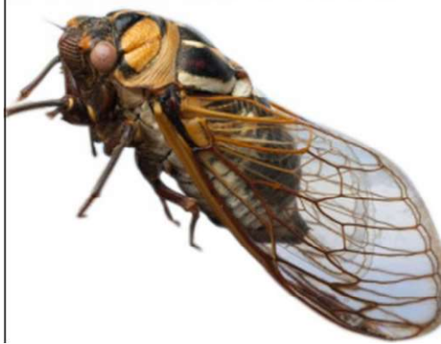
Le cigale craquette