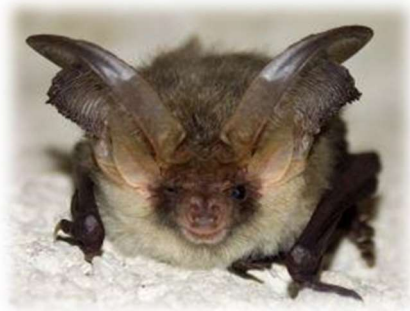
Le chauve souris grince