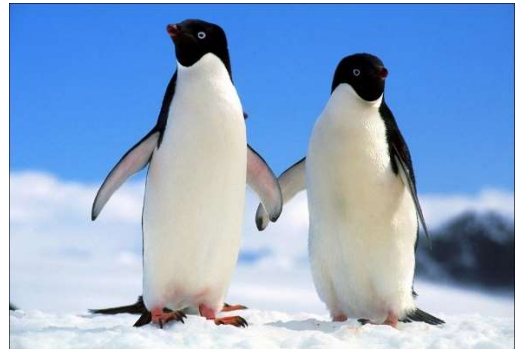
Le pingouin jabote