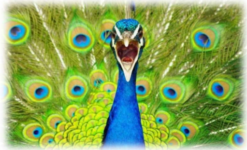
Le paon braille ou criaille