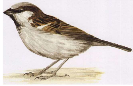
Le moineau pépie