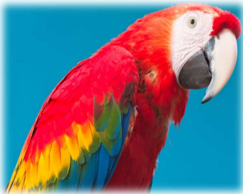
Le perroquet craque