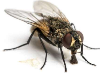
La mouche bourdonne