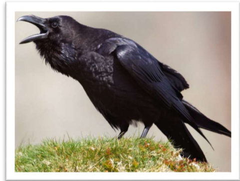
Le corbeau croasse