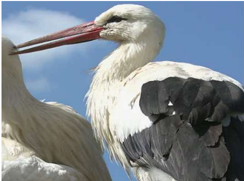
La cigogne claquette ou craquette