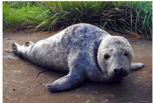
Le phoque bêle ou grogne