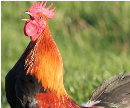
Le coq chante ou coqueline