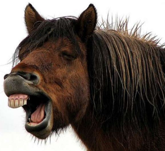
Le cheval hennit