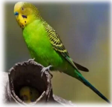
La perruche jabote