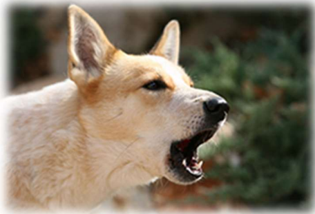
Le chien aboie ou gronde