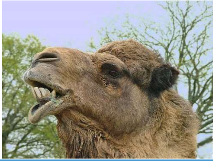
Le chameau blatère