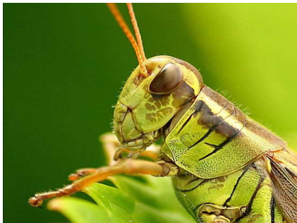
Le criquet stridule