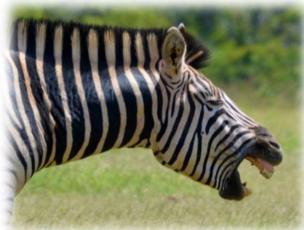
Le zèbre hennit