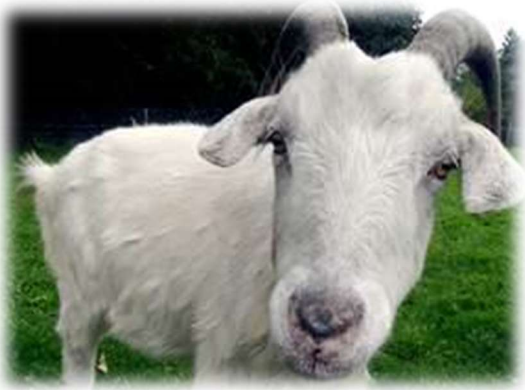
La chèvre bêle