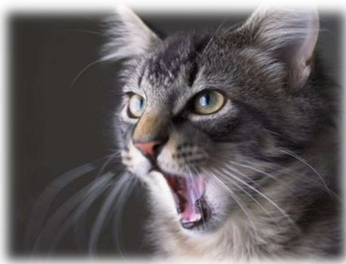
Le chat miaule ou ronronne