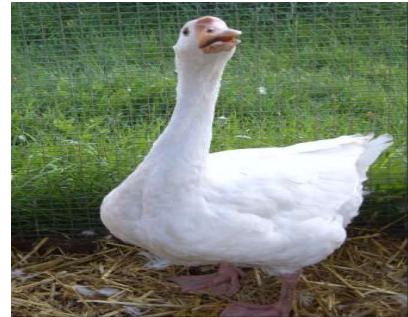
L'oie siffle ou cacarde