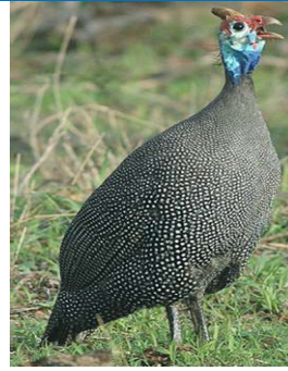
الدجاج الحبشي 25 يوم