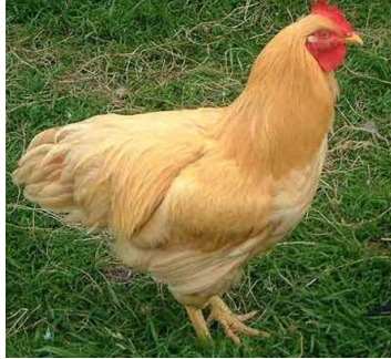
الدجاجة 21 يوم