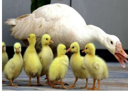
الإوزة 28 يوم