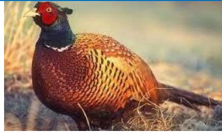
ديك بري 23 يوم