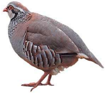
الحجلة 21 يوم