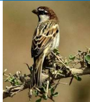
عصفور الدوري 23 يوم