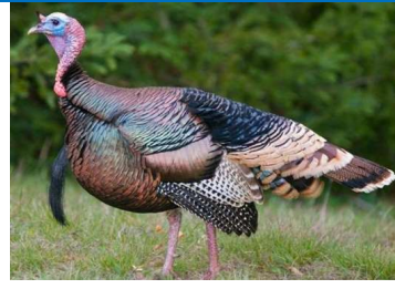
ديك رومي 28 يوم