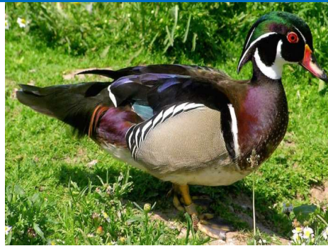
البطة 25 يوم