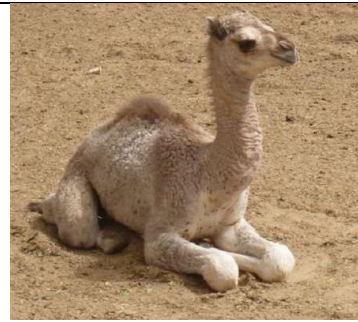
هبع أو حوار