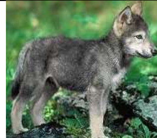
سيمع أو ديسم أو عسبار