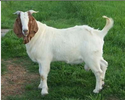
ماعز أو تيس