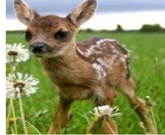
الخشيش أو الطّلا أو الشّادن