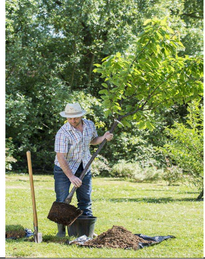
حفر الفلاح حفرة و غرس فيها شجرة