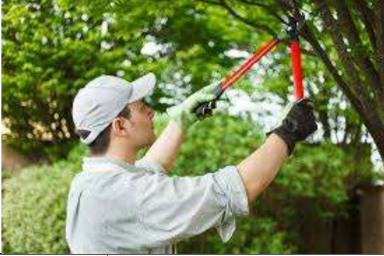
قصّ الأغصان و شدّبها