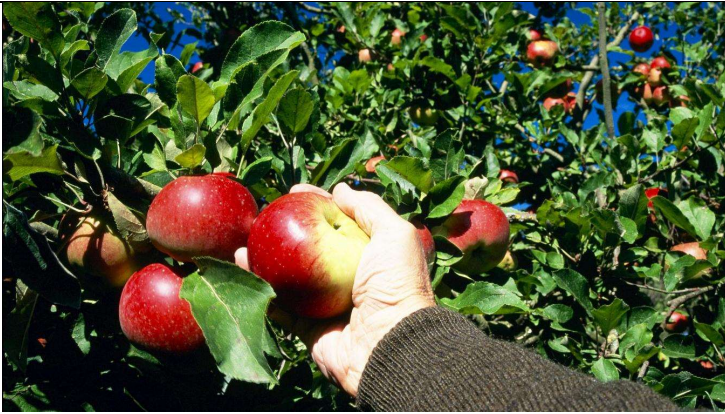
جنى الغلال الشهية الطازجة