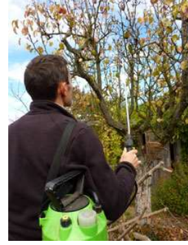
قام بمداواتها ضد الحشرات و الطفيليات و الامراض المختلفة