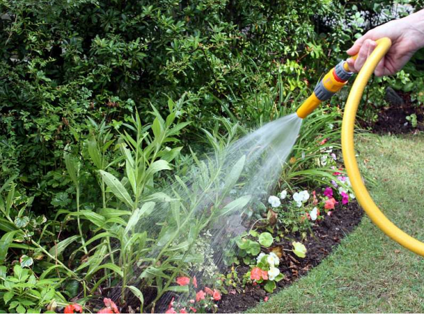
تعهدّها بالسقاية المنتظمة