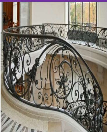
السلالم و الدرج