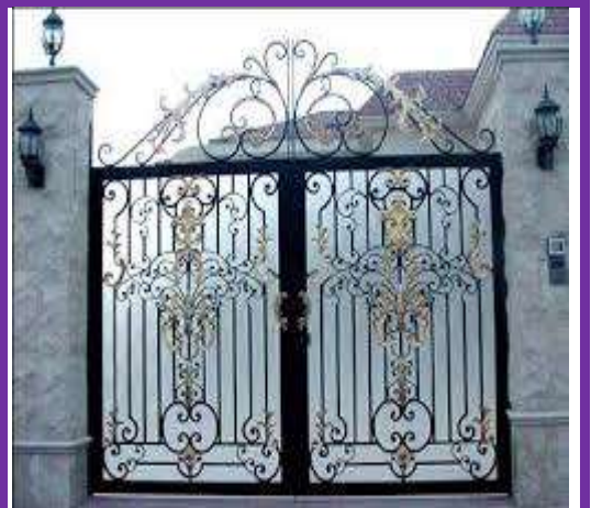
الأبواب و النوافذ