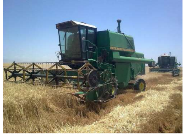
الحصادة أو الآلة الحاصدة : آلة عصرية لحصاد القمح والشعير