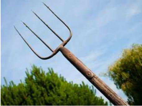
المذراة : تستخدم في فصل حبوب القمح عن التبن، بذروهما في ضد اتجاه الرياح فيقع القمح في جهة وتحمل الرياح الخفيفة التبن إلى الجهة الأخرى،