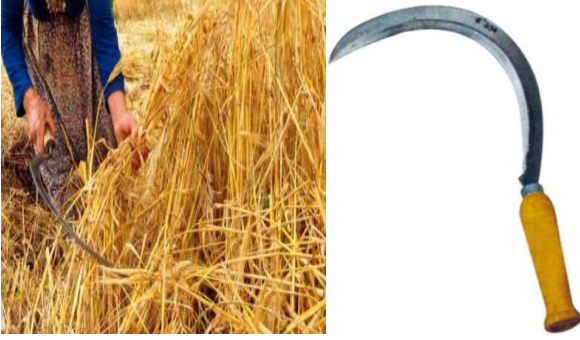
المنجل : آلة تقليدية لحصاد الحبوب هي آلة صغيرة مكونة من الفولاذ أو الحديد المطروق؛ حافتها الداخلية حادة لغرض قطع النباتات بها (الحنطة والشعير والعدس و القمح) .