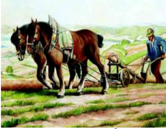
المحراث التقليدي : يجره الفلاح خلف حصان أو حمار أو ثور