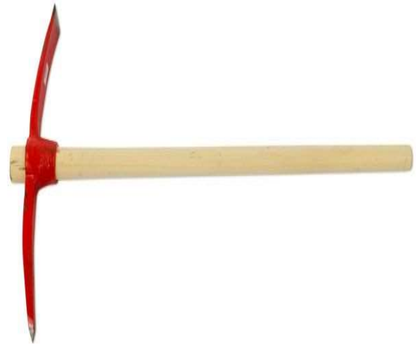
المعول أداة لحفر التراب .