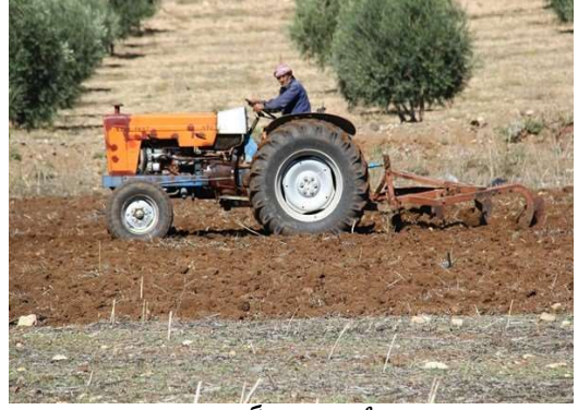
الجرار : يستعمله الفلاح لحرارة الأرض و تقليب التربة، كذلك يمكن أن ينقل به المحاصيل إلى السوق عندما يربط به عربة مجهزة