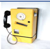
Un taxi phone