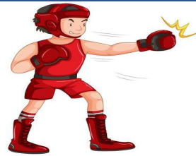
Un box eur