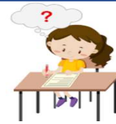
Un ex ercice