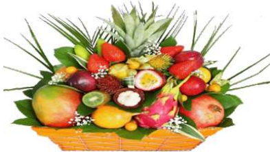
Un fruit ex otique