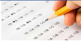
Un ex amen