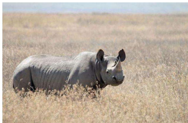
4. Le rhinocéros noir