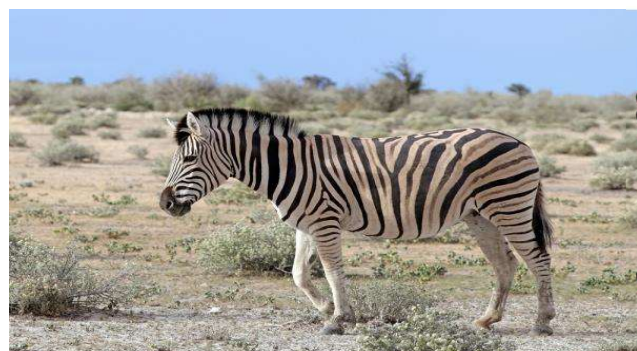
13. La gazelle