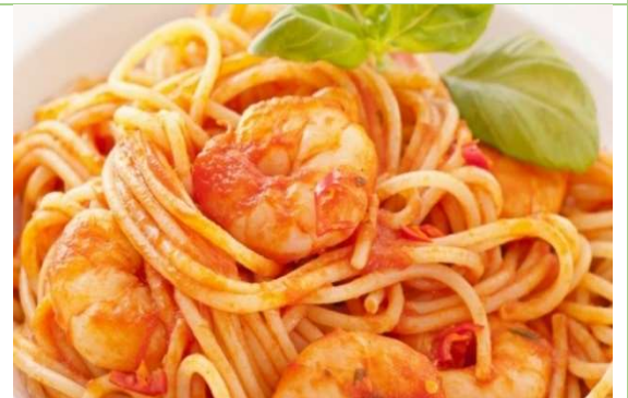
المأكولات المطبوخة: المكرونة