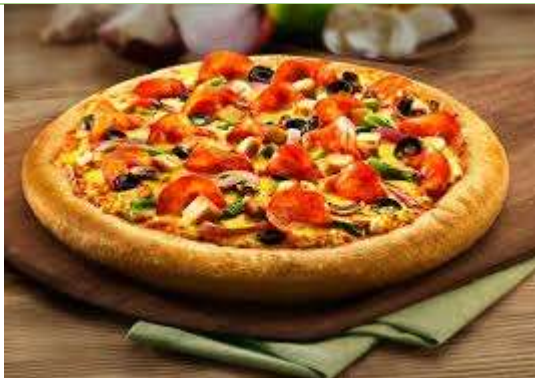
المأكولات المطبوخة: البيتزا