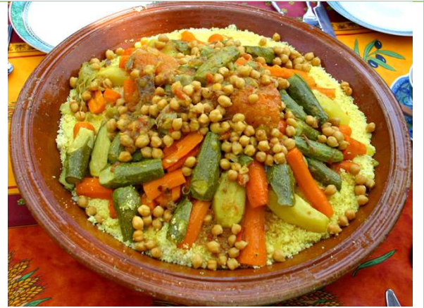
المأكولات المطبوخة: كسكسي