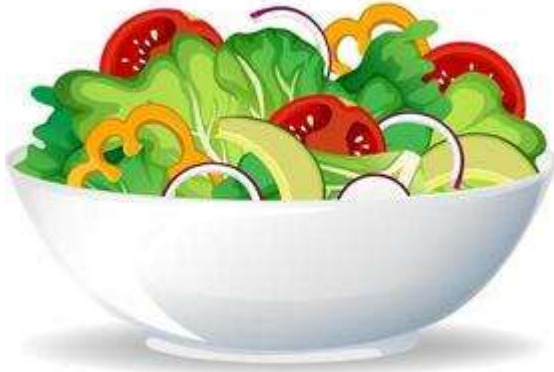
المأكولات الطازجة : السلطة