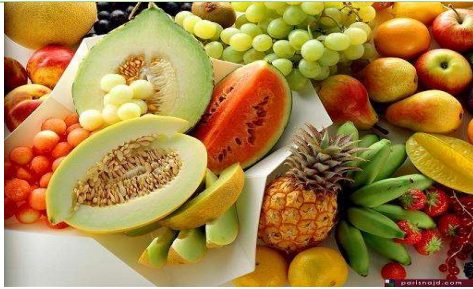
المأكولات الطازجة : الغلال