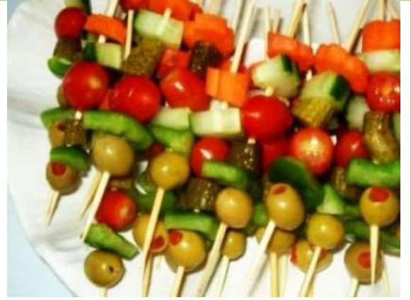
المأكولات الطازجة : المخللات