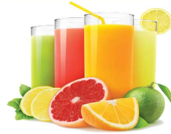
المشروبات الطازجة : العصائر