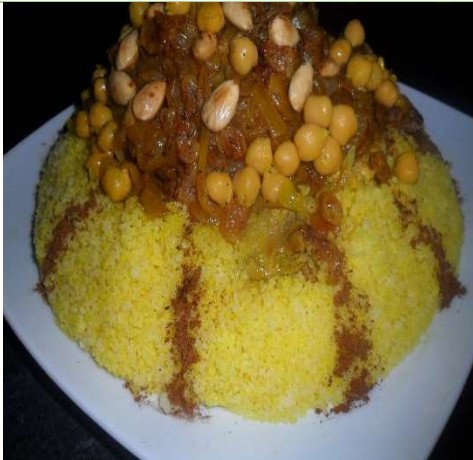
المأكولات المطبوخة: الأرز