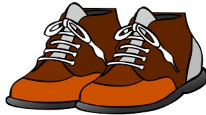
des chaussures – des chaussures