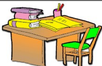
un bureau – un bureau