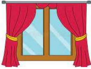
un rideau – un rideau