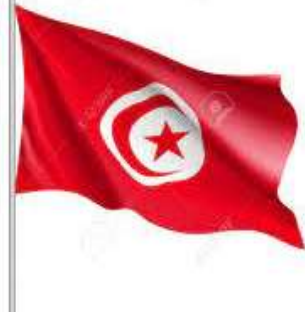
un drapeau – un drapeau