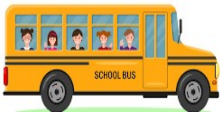
une autobus – une autobus