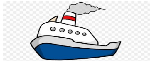
un bateau – un bateau