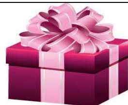
un cadeau – un cadeau