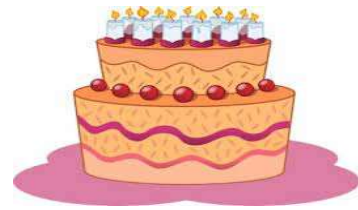
un gâteau – un gâteau