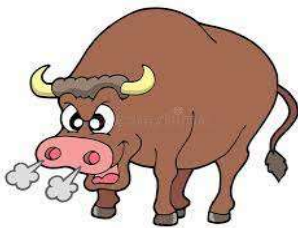
un taureau – un taureau