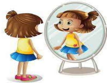
le miroir – le miroir