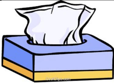
un mouchoir – un mouchoir