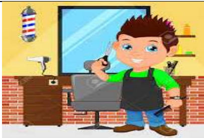
le coiffeur – le coiffeur