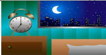
le soir – le soir