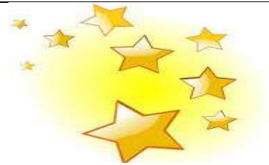
des étoiles – des étoiles