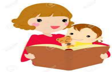
une histoire – une histoire