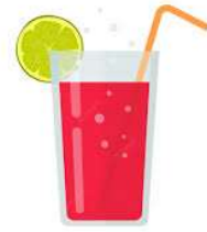
une boisson – une boisson